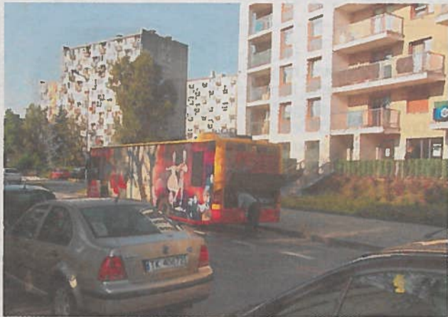
► Mieszkańcy ulicy Kaczmarka skarżą się na kierowców miejskich autobusów, które przy tej ulicy mają przystanki końcowe.

Dodaje, że kierowcom samochodów osobowych też wiele można zarzucić. - W tym miejscu jeżdżą szybko, nie zwracając uwagi na przejście dla pieszych oraz parkują tuż przy nim. Ulica jest źle oznakowana, granica parkingu jest źle namalowana, za blisko skrzyżowania. Straż Miejska interweniuje tu prawie codziennie.